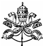
DICASTERO PONTIFICIO DELLA CULTURA E L'EDUCAZIONE

Il Convegno è organizzato in collaborazione con l'Ufficio Liturgico Nazionale e l'Ufficio Nazionale per i beni culturali ecclesiastici e l'edilizia di culto della Conferenza Episcopale Italiana e sotto gli auspici del Dicastero Pontificio della Cultura e l'Educazione.