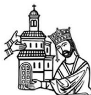
CEI - UFFICIO NAZIONALE PER I BENI CULTURALI E L'EDILIZIA DI CULTO